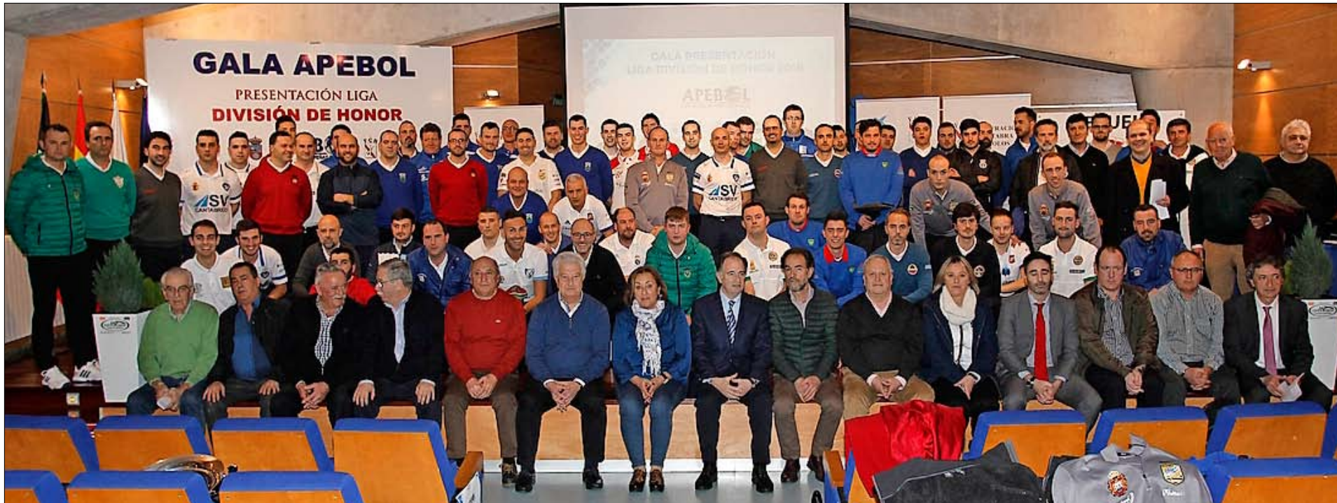
Foto de familia con los jugadores, presidentes y autoridades tras la presentación.