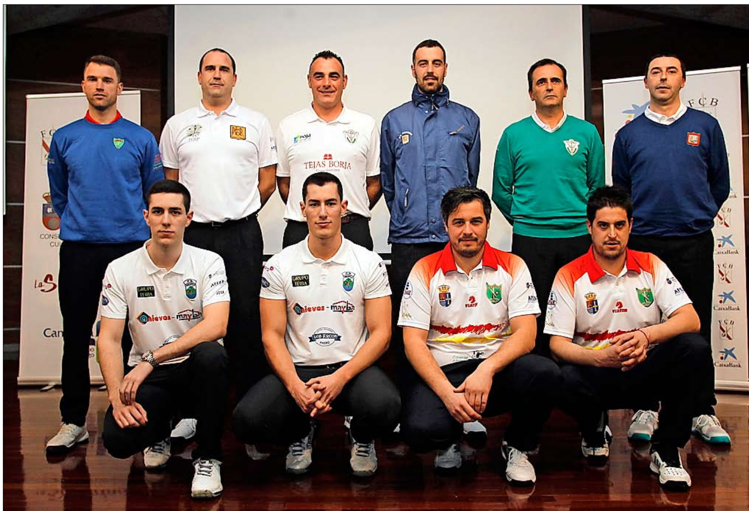
Seis parejas de hermanos competirán este año en la Liga de División de Honor.