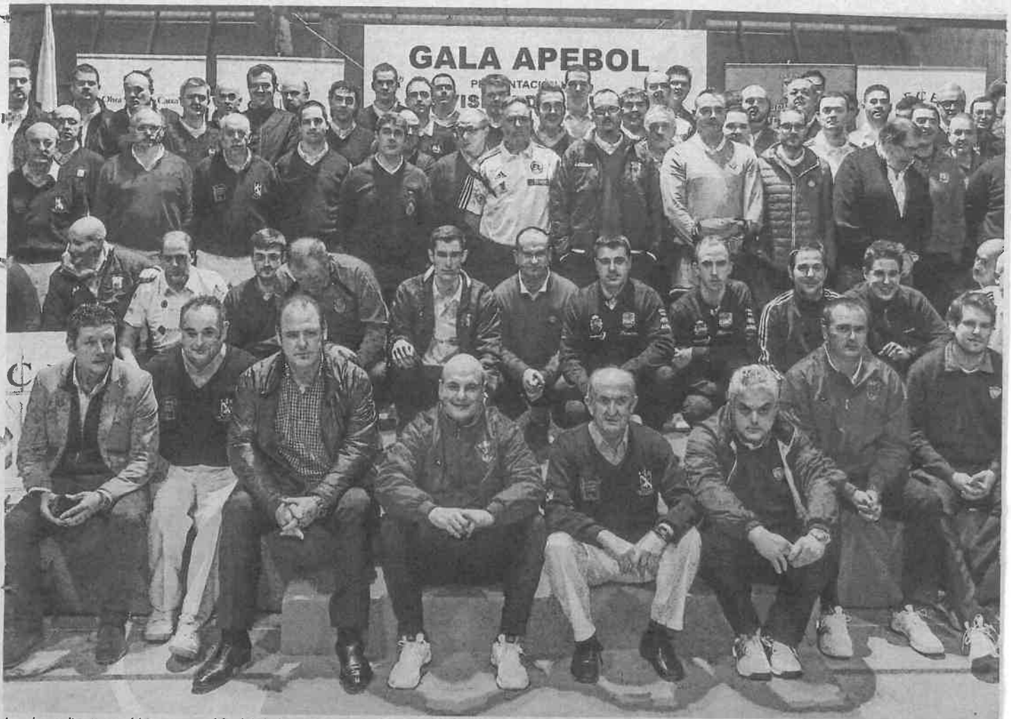
Jugadores, directivos y árbitros posan al final de la fiesta de presentación de la División de Honor 2016.