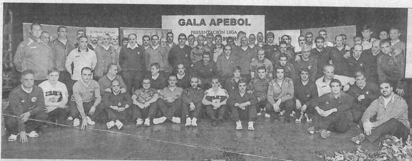
Jugadores que disputarán la Liga de la máxima categoría esta temporada.