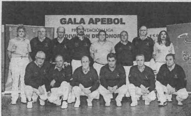
Como todos los años en la presentación de la Liga Apebol hubo una representación del colectivo arbitral de la máxima categoría.