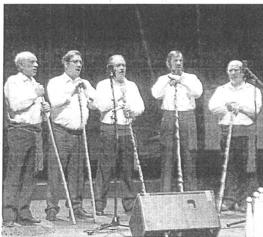
El coro Los Avellanos amenizó el acto.